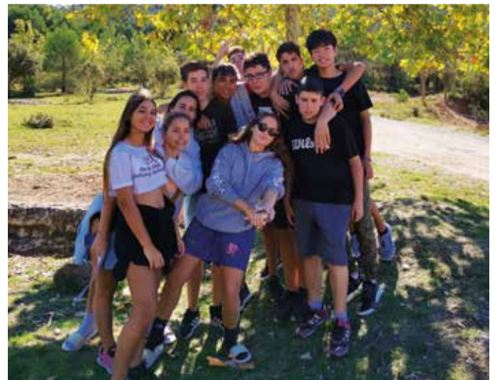
Les estades que es realitzen a inici de curs faciliten la integració dels nous alumnes.

Per als alumnes més veterans a l'Escola, la sortida a Capafonts suposa recordar raons i paisatges que van visitar anys enrere durant la seva etapa a Primària. Per als nous, és una oportunitat de descobrir un espai únic pel seu entorn natural i, sobretot, pel fet de començar a viure-hi experiències amb els nous companys. L'estada de les classes de Secundària té una durada de dos dies i una nit, i les activitats de tutoria i cohesió varien en funció de cada grup: de jocs de rol i lògica a gimcanes fotogràfiques i d'altres activitats de cooperació. Una activitat imprescindible per a tots ells és l'excursió al poble de Capafonts, ubicat a uns dos quilòmetres de la casa, per visitar l'església i conèixer l'entorn rural de la serra de Prades.