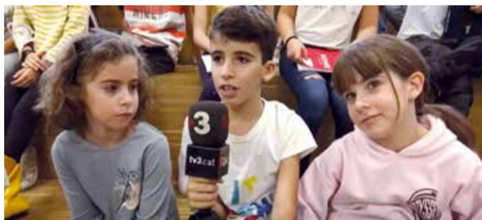
Reportatge a l'InfoK sobre les eleccions.